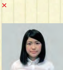
写真サイズが横に長い