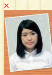
証明写真の再撮影