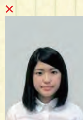
頭上の余白部分が多い