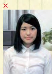
背景に家具等が写っている