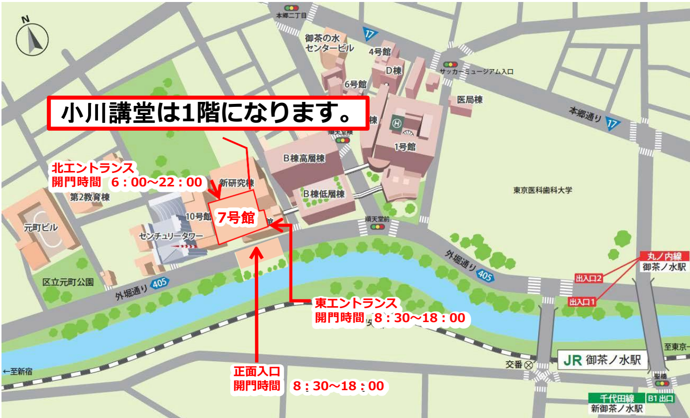
1F 北エントランスから入館の場合